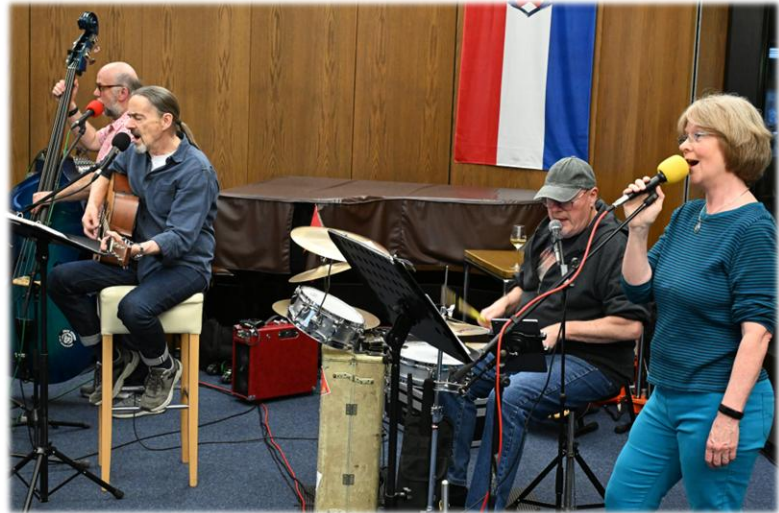
Die Band Toms and Jerrys begleitet durch die Veranstaltung