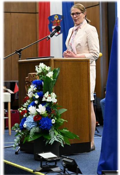
Grußworte der Oberurseler Bürgermeisterin Antje Runge