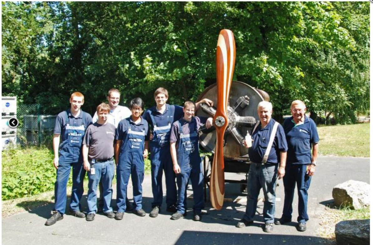
Die Mannschaft freut sich auf den ersten Lauf