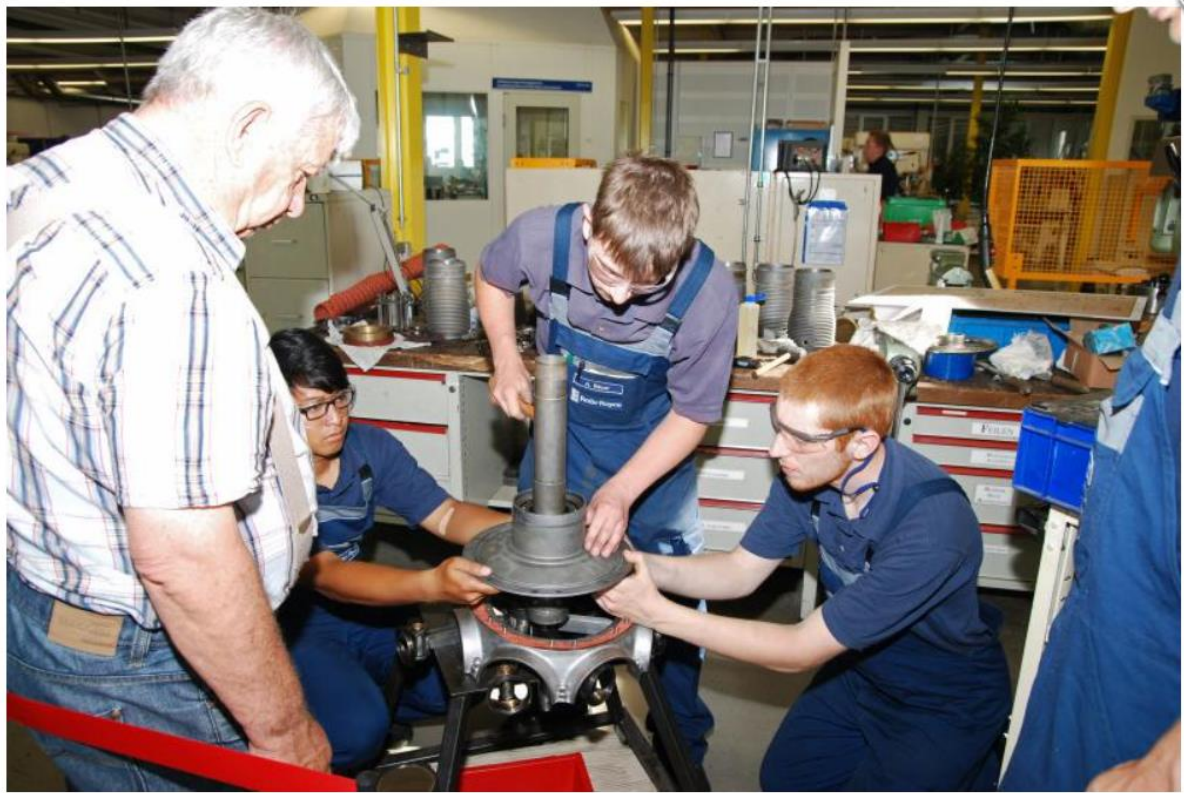
Die Rückseite des Motors wird montiert