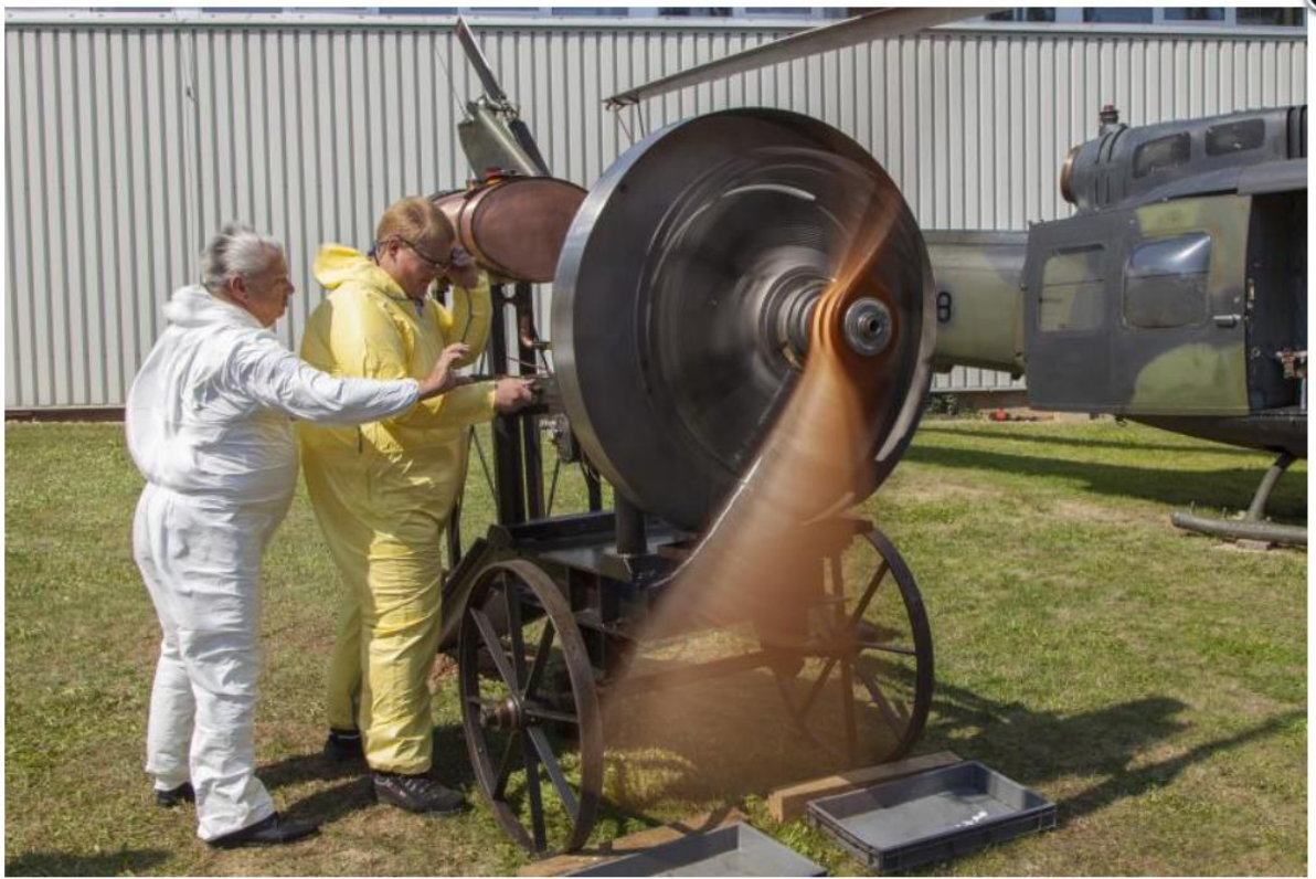
Bei der 100Jahr-Feier wird der Motor präsentiert