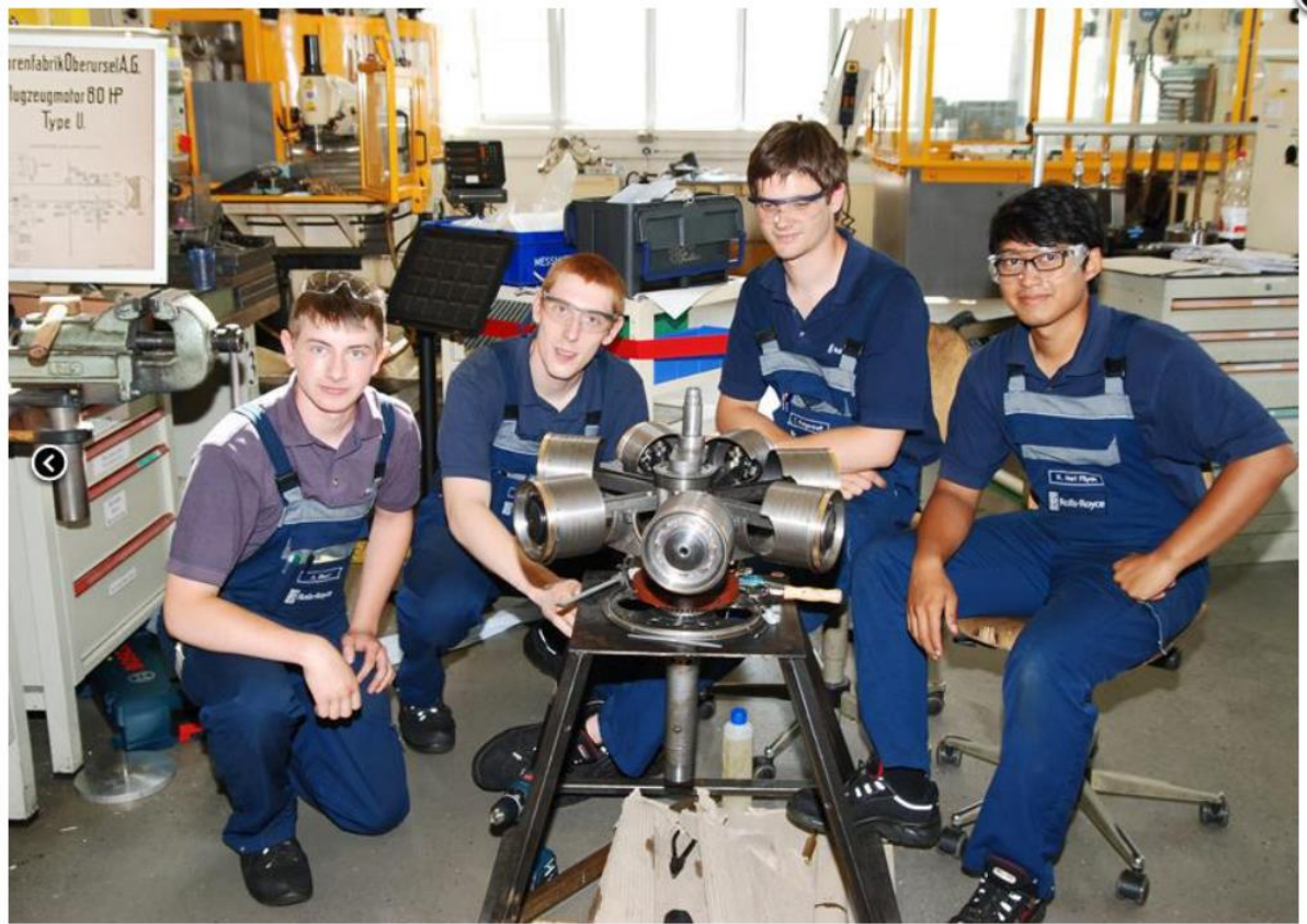
Kolben und Einlassventile sind montiert