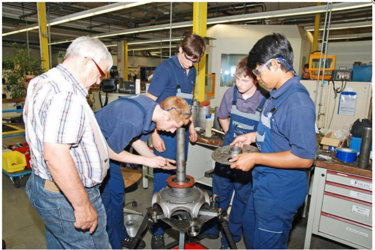
Der Zündverteiler und die Aufnahmeplatte werden montiert