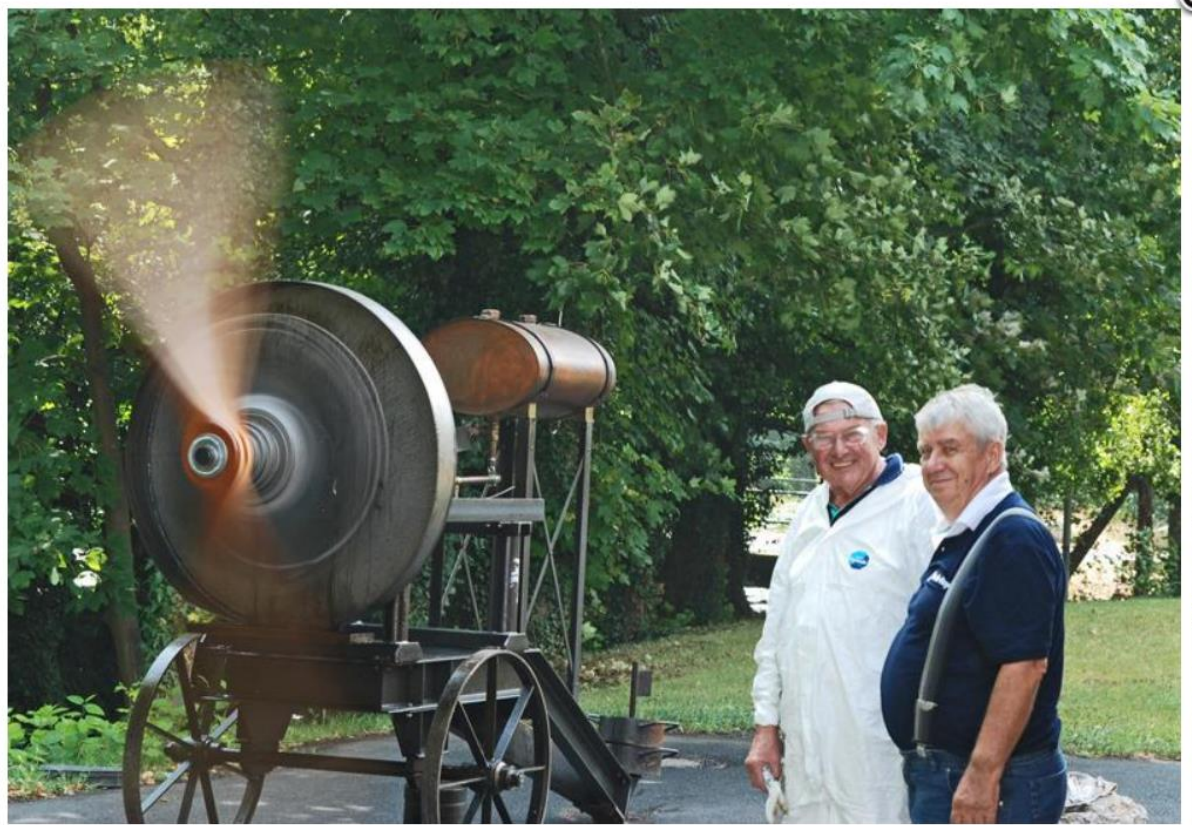
Ein 100jähriger meldet sich Eindrucksvoll zu Wort