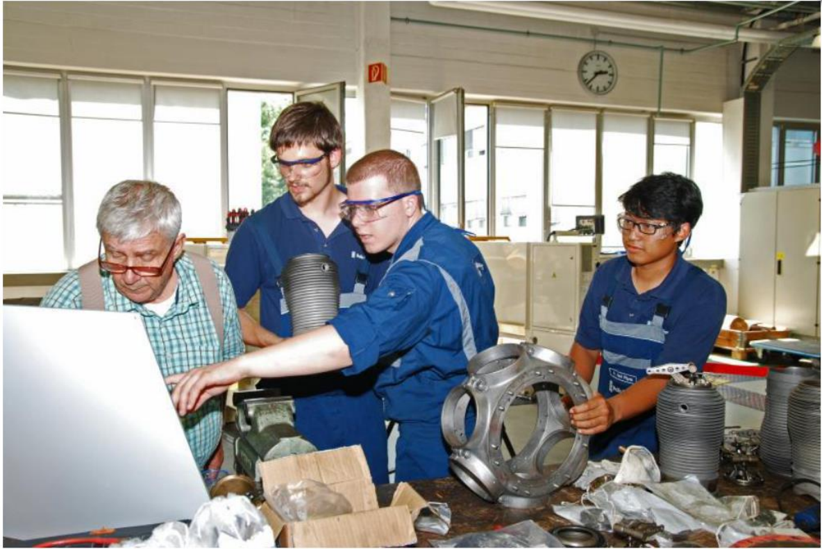
Das Kurbelgehäuse wird vorbereitet