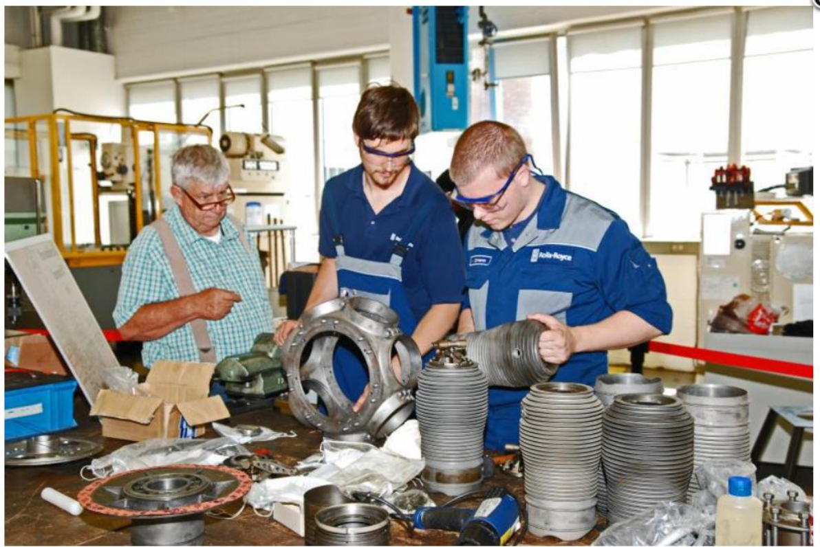
Die Zylinder werden vorbereitet