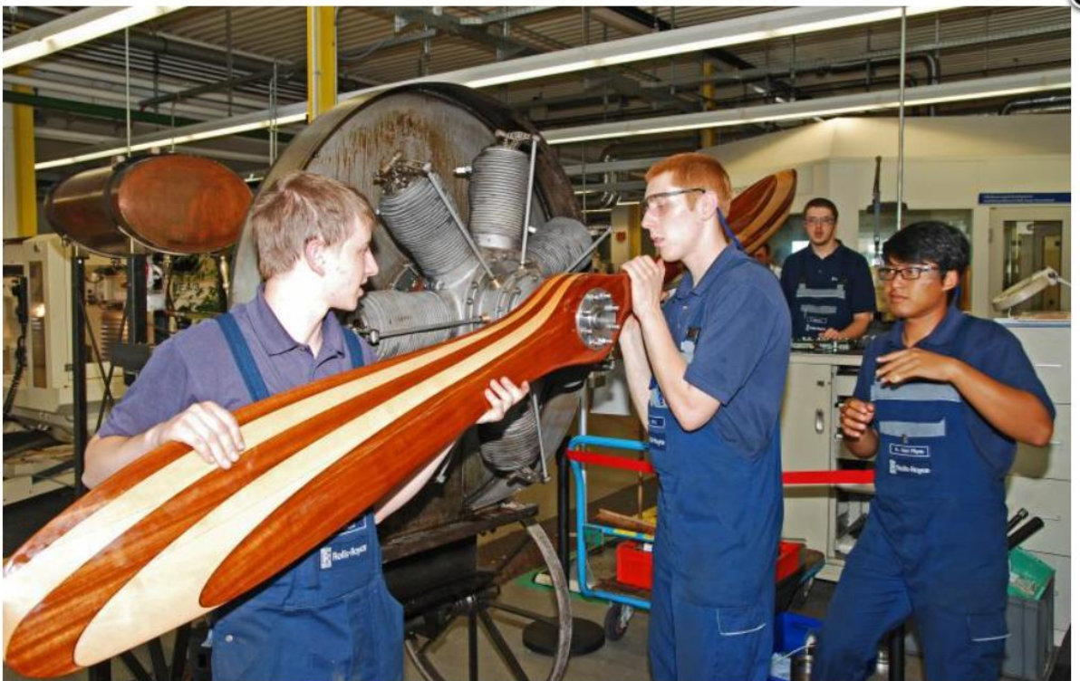
Der Propeller wird angebaut