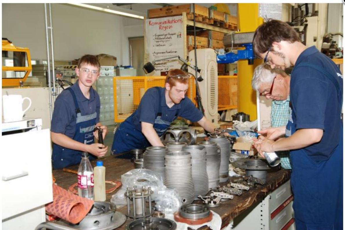
Die Montage wird vorbereitet