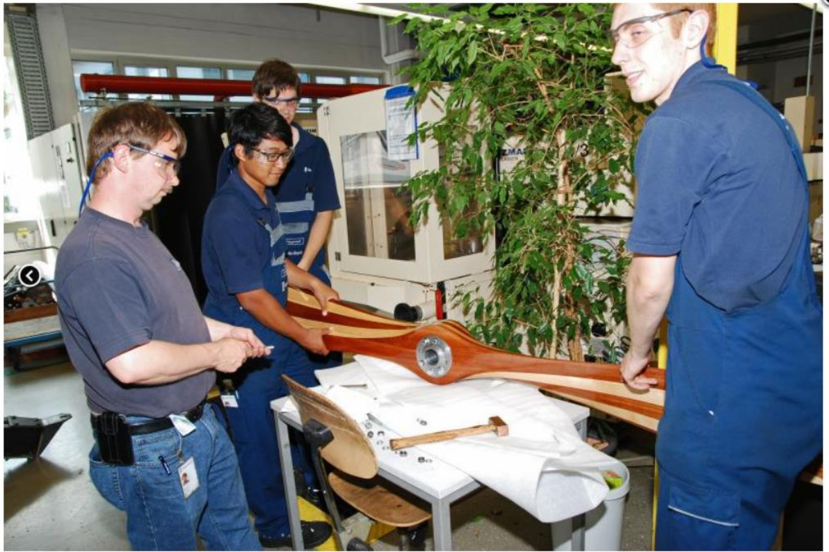
Die Propellernarbe wird montiert