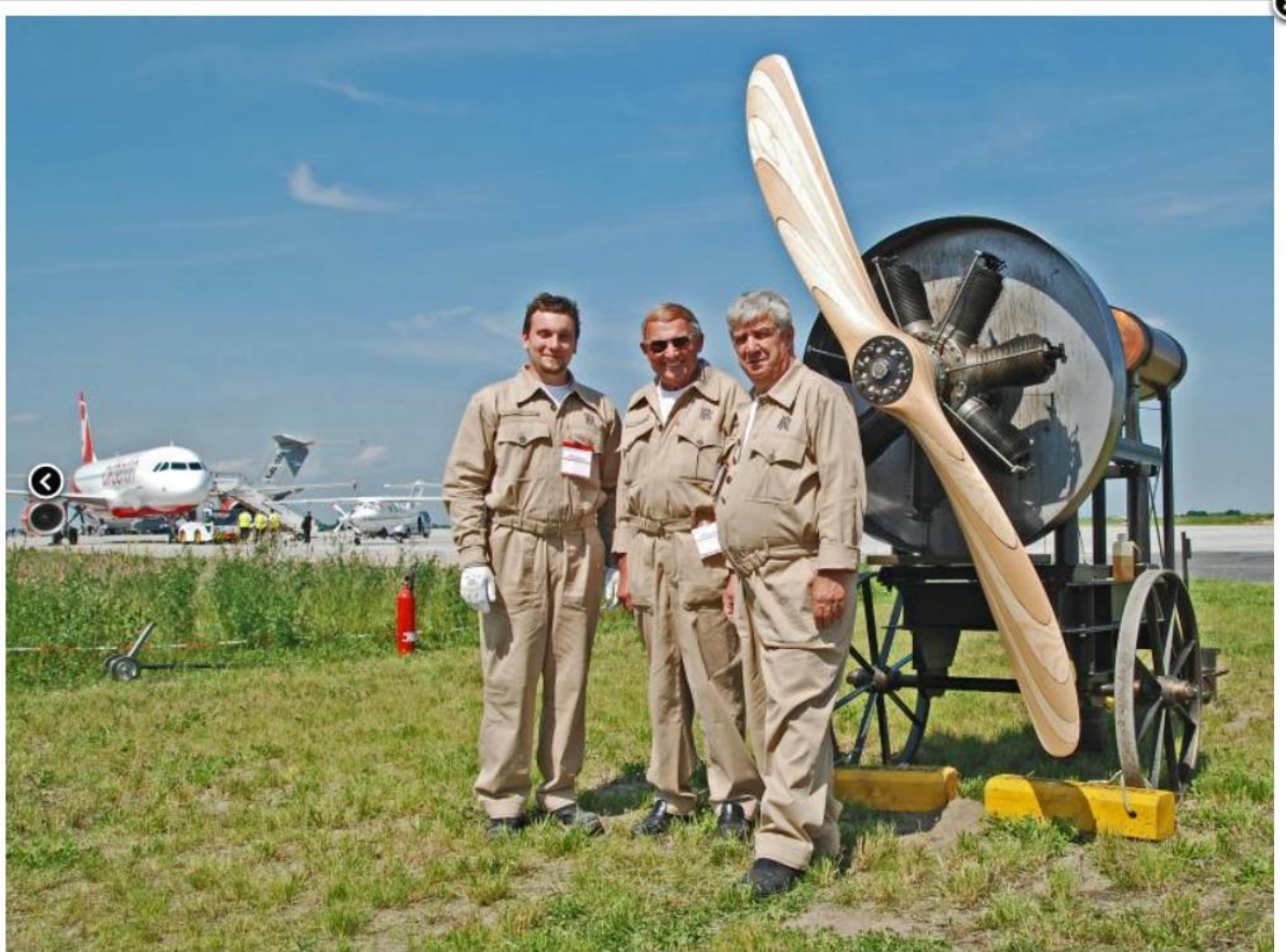
Bild 06 - Die Mannschaft