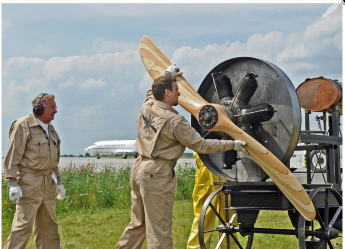
Bild 07 - Startvorbereitung