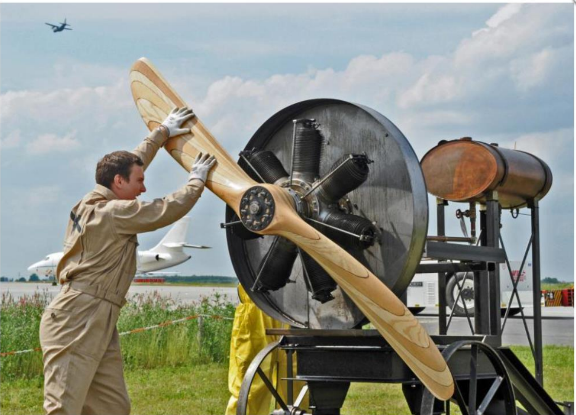
Bild 09 - In die Zylinder wird Kraftstoff gespritzt