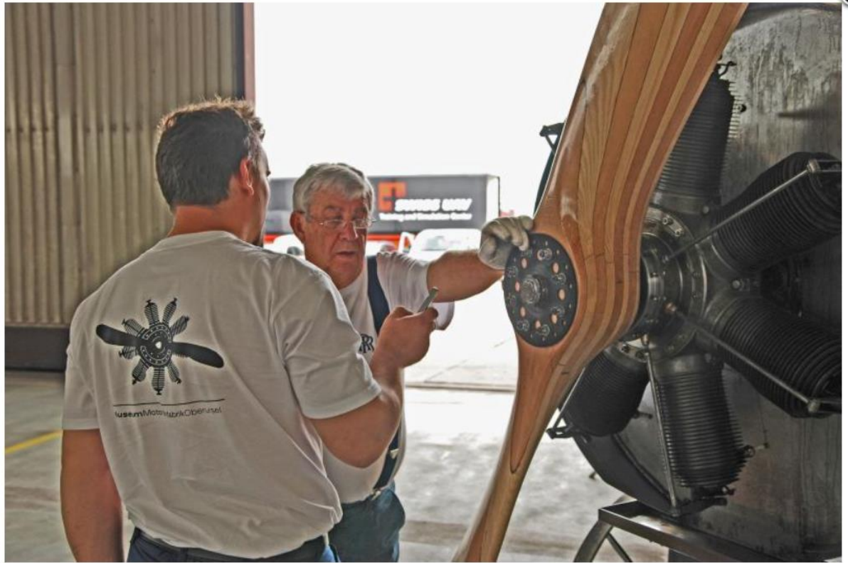
Bild 03 - Vorbereitungen