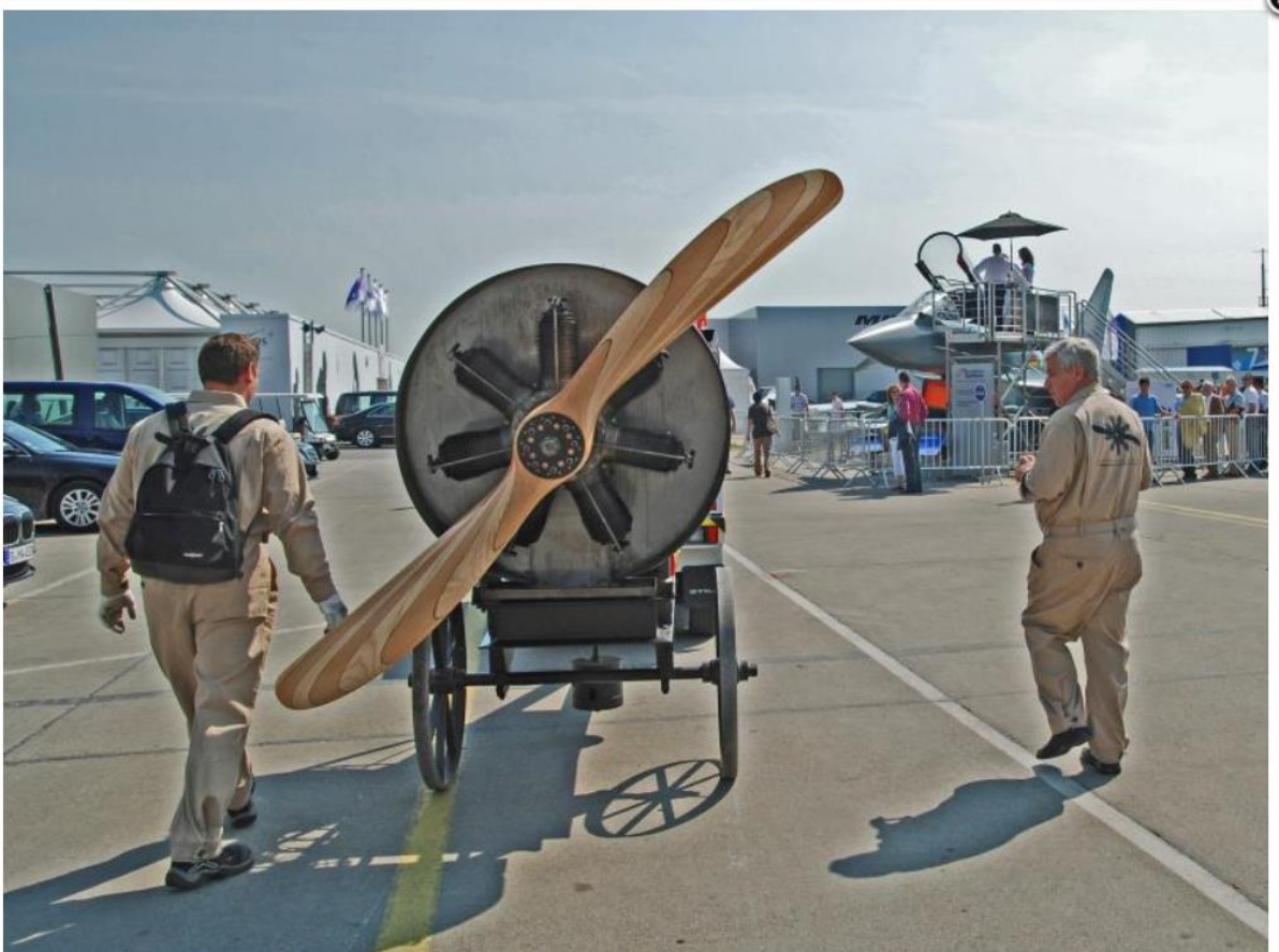
Bild 04 - Auf dem Weg zum Probelauf