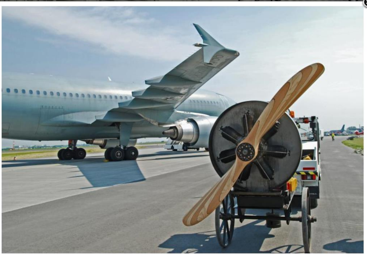
Bild 05 - Generationen begegnen sich