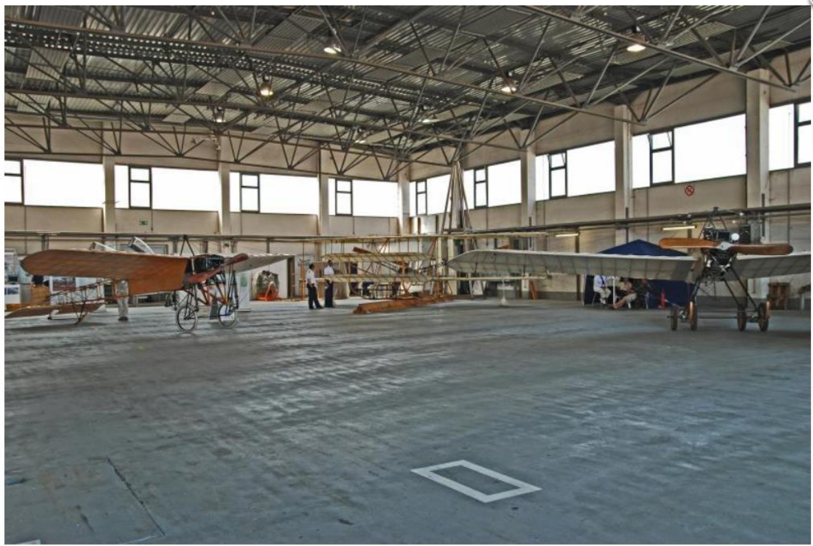
Bild 01 - Ausstellung 100 Jahre Motorflug in Deutschland