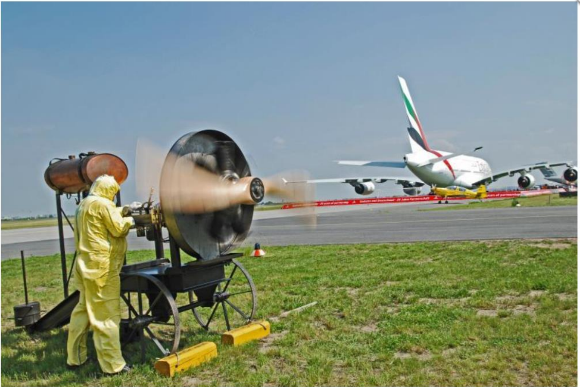
Bild 11 - Der Motor läuft.